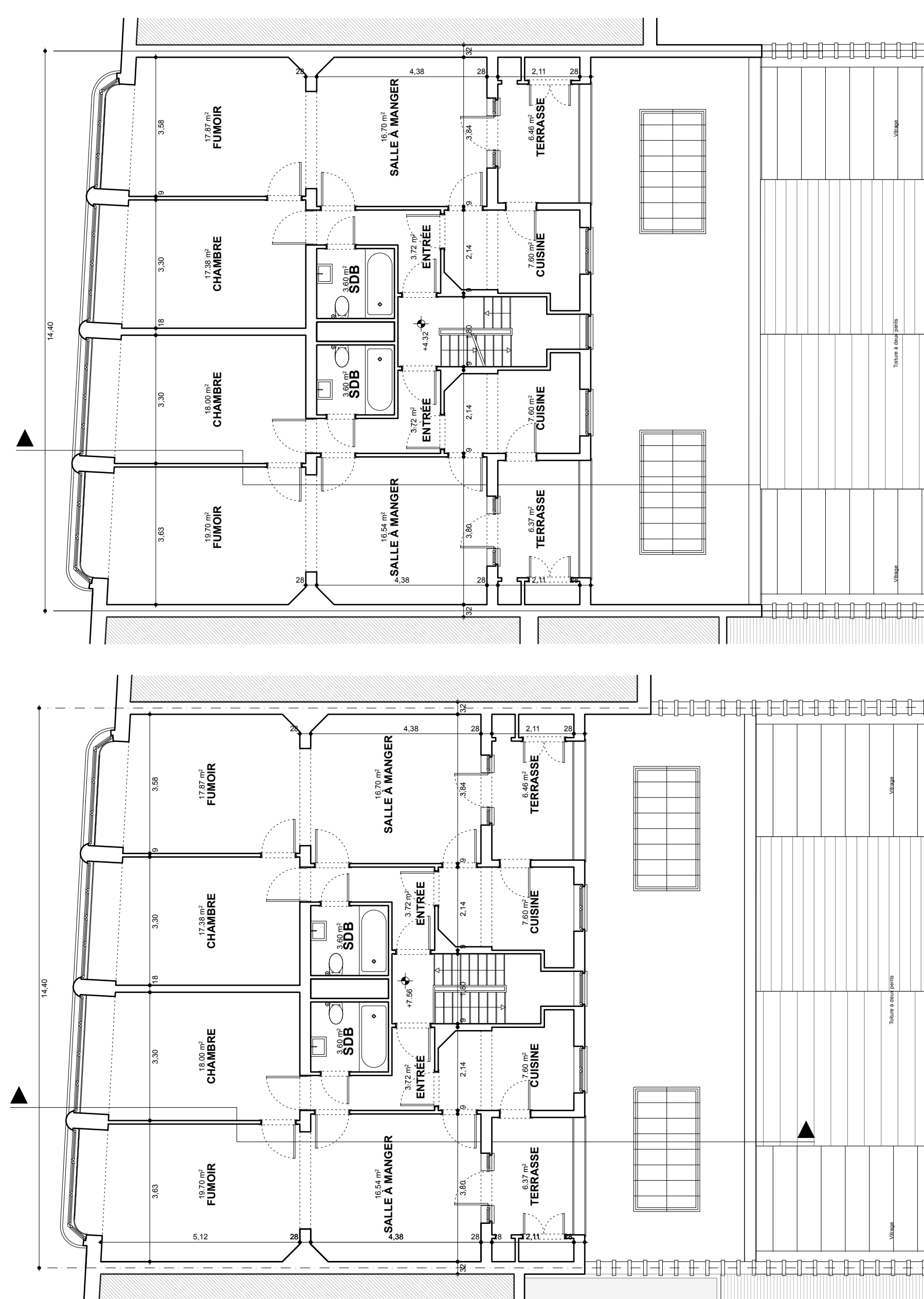
PLAN R+1 - échelle 1/100 Situation de droit